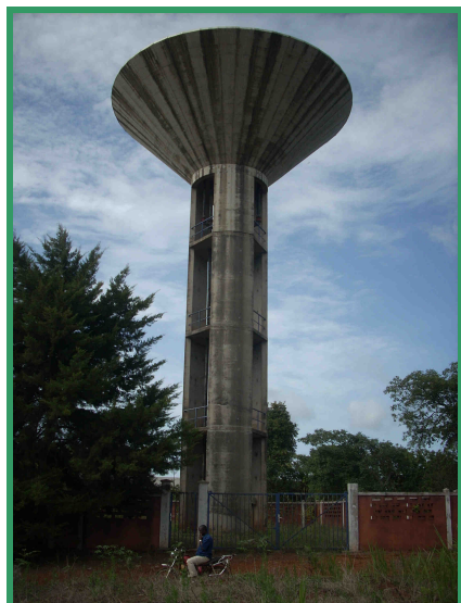
Château d'eau CAMWATER à Baham

Ces deux Schémas Directeurs, aux dimensions à la fois techniques, économiques, socioéconomiques et financières, ont été réalisés dans le cadre d'une assistance technique et méthodologique coordonnée par CODEA au profit des 4 Communes précitées, qui disposent aujourd'hui d'une vision et d'une force de proposition structurée pour l'accès à l'eau et à l'électricité à l'échelle de leurs territoires respectifs : un atout et un avantage comparatif vis-à-vis d'autres collectivités locales, dans la perspective de financements potentiels.