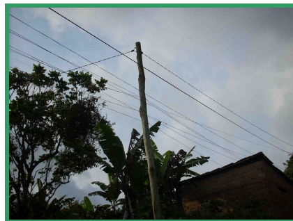
Branchements en "toile d'araignée" dans les Hauts-Plateaux