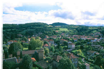
Une vue de Saint-Germain-au-Mont-D'or (Rhône-Alpes, France)

CODEA est à l'origine de la signature d'une convention de coopération décentralisée entre la Commune de Baham (Région de l'Ouest / Département des Hauts-Plateaux) et la Commune française de Saint-Germain-au-Mont-D'or. Les engagements de cofinancements obtenus en France dans le cadre des projets cités ci-après (Fonds de Solidarité Eau du Grand Lyon/VEOLIA, Ministère des Affaires Etrangères et Européennes) résultent de l'intermédiation de la Commune Saint-Germain-au-Mont-D'or.